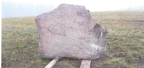
Kivi edestä katsottuna Korkeus 125 cm Leveys 103 cm Syvyys 40 cm

Hakijat ovat esittäneet karttaluonnoksessaan muistokiven paikaksi seurakunnan info-taulun ja kellotapulien välistä aluetta. Tuohon esitetylle paikalle muistokiveä ei ole syytä asentaa, koska kohtuullisen suurikokoisena se on kovin hallitseva ja toisaalta haittaa myös jonkin verran kiinteistön huoltotöitä. Kirkon tontin alueella on muistokivelle löydettävissä useita sijoituspaikkoja, joissa sen huomioarvo olisi myös huomattavasti esitettyä sijoituspaikkaa parempi.