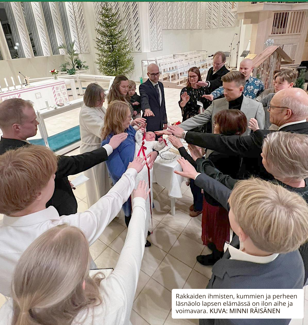
Rakkaiden ihmisten, kummien ja perheen läsnäolo lapsen elämässä on ilon aihe ja voimavara.