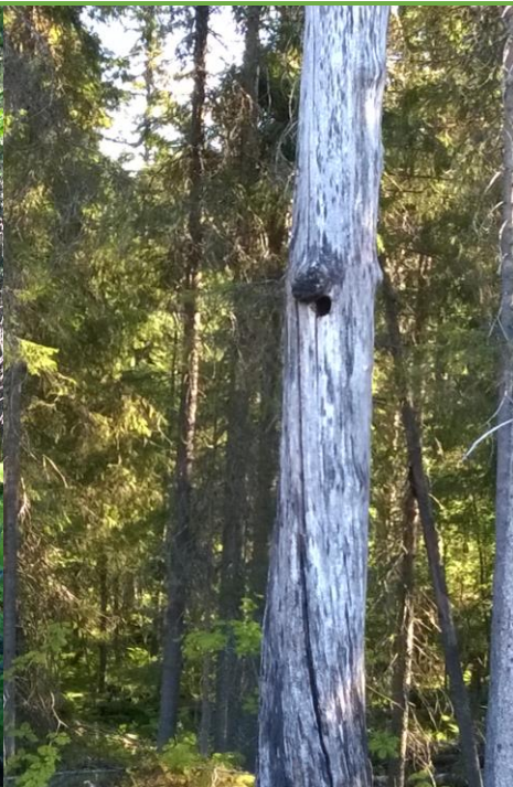
Kuva: Räpsynvaara, kolopuu