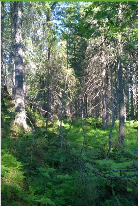
Kuva: Räpsynvaara, Korpikaistale