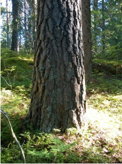
Kuva: Räpsy, vanhoja puita