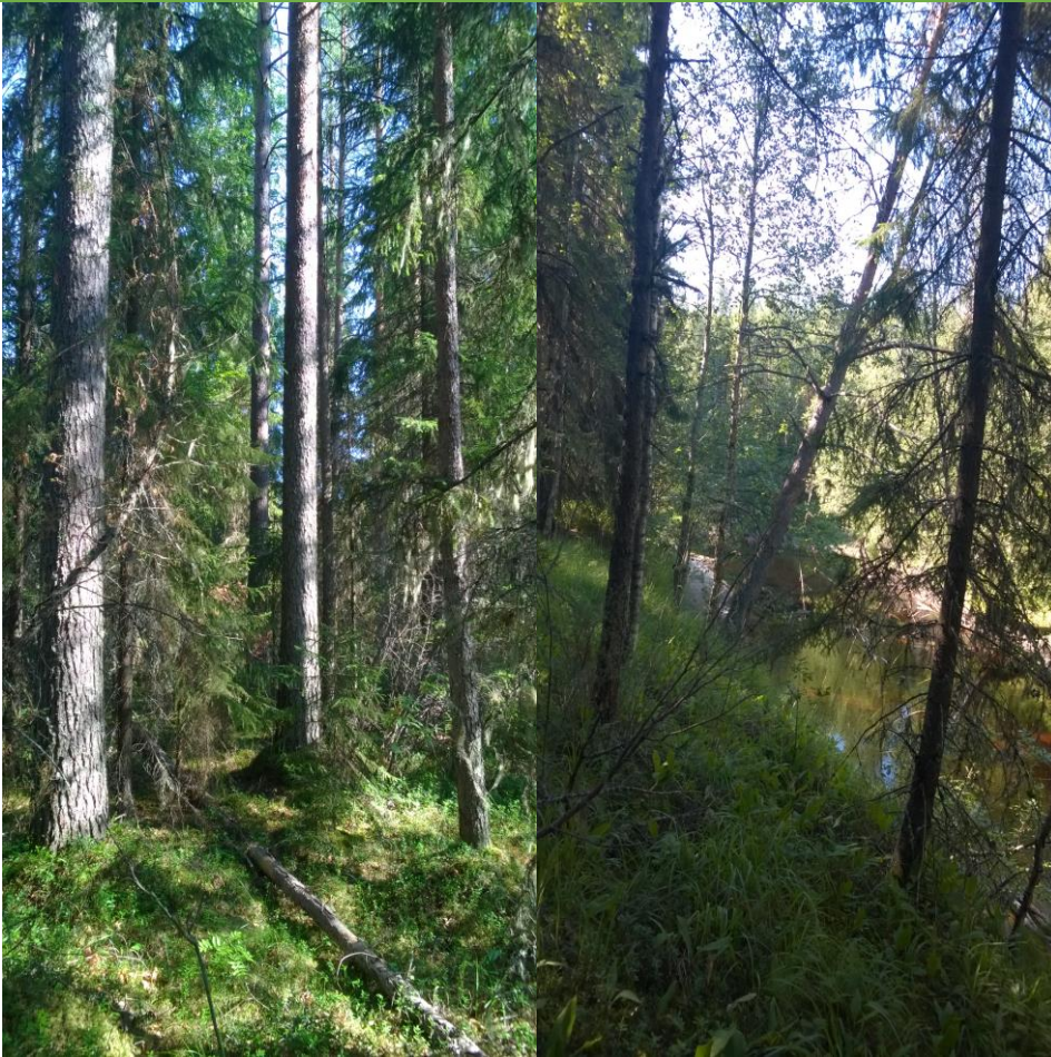
Kuva: Valkeinen, vanhoja puita