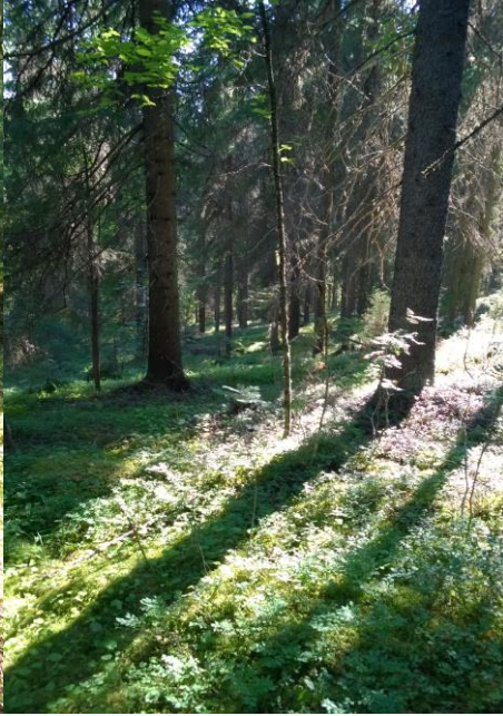
Kuva: Räpsy, jyrkkää rinnettä