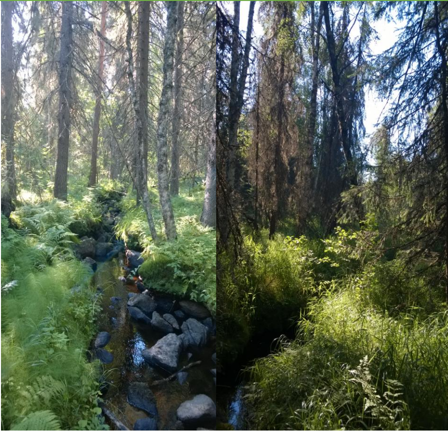
Kuva: Takamaa, puro